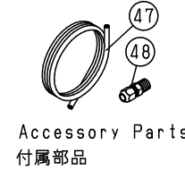
Accessory Parts 付属部品